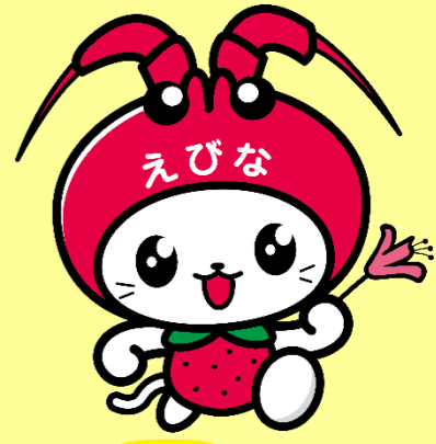
海老名市イメージキャラクター

★申請及び実績報告 賃貸借契約の前日までに申請を行い、入居の6か月後に実績報告を行うものとする。