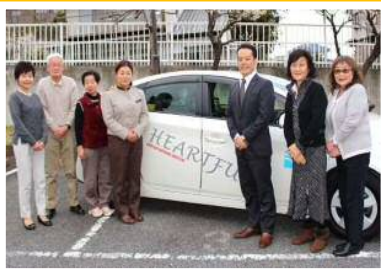
ハートフルタクシーの皆さんと一緒に記念撮影

家族や会社の理解があり、自分もやりがいを感じ、そして子どもも近くにいることで安心して働ける。ママさんドライバーはイキイキと輝いていました！