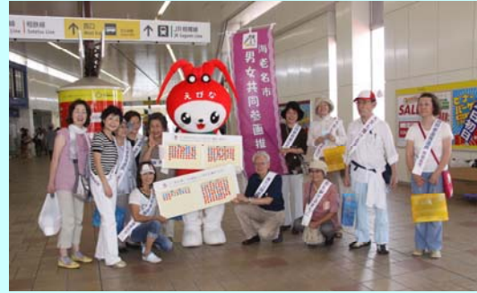
推進員の皆さんです

男女共同参画週間中(6月23日～29日)のイベントとして、海老名市のイメージキャラクター『えび～にゃ』と一緒に街頭アンケート「100人に聞きました」を実施、市民の皆さんに以下の2つの質問をしました。