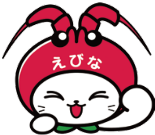
海老名市イメージキャラクター えび~にゃ

「ME-BYO スタイル」とは、手軽にできる「未病の改善」の方法を生活習慣に取り入れたライフスタイルのことです。 「ME-BYO (未病)」に親しみをもち、日常生活の中で未病改善できるコンテンツ等を神奈川 ME-BYO スタイルアンバサダーと一緒にお届けします。