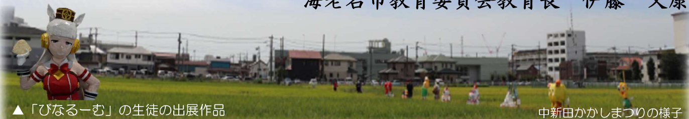
▲「びなる一む」の生徒の出展作品