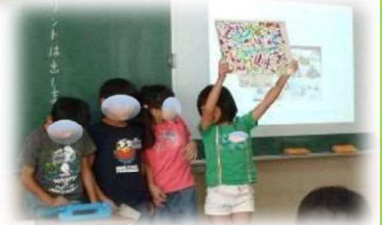
小学3年 総合▶ 見つけた生き物を調べて発表している様子

海老名市では、「安心・安全・快適」にiPadやChromebookを利用するために「えびなルール」を定めました。