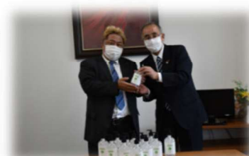
▲近代化学株式会社 様