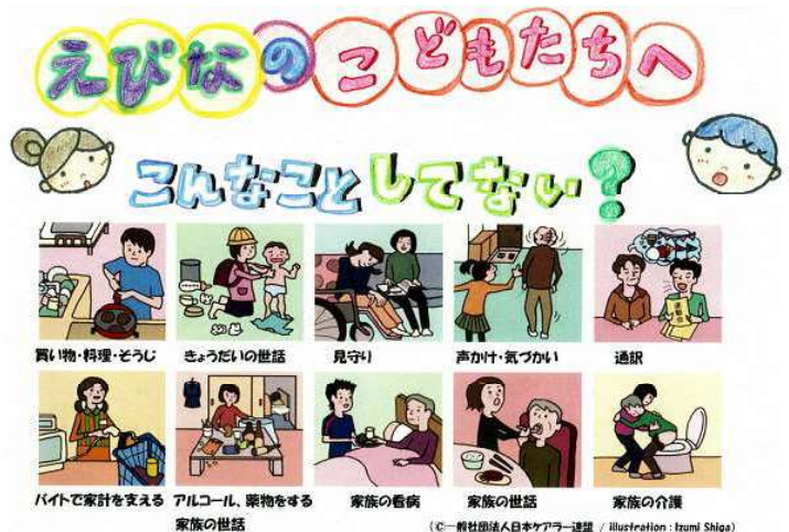
▲リーフレット一部抜粋

ヤングケアラーになる可能性のある子どもに最も身近な学校で、子どもたちに寄り添った支援を関係機関と連携して進めていきます。