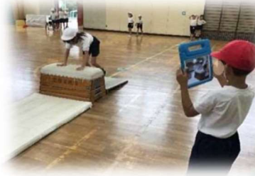
◀小学2年 体育 跳び箱のフォームを撮影してチェックしている様子