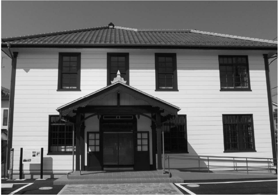
郷土資料館（温故館）