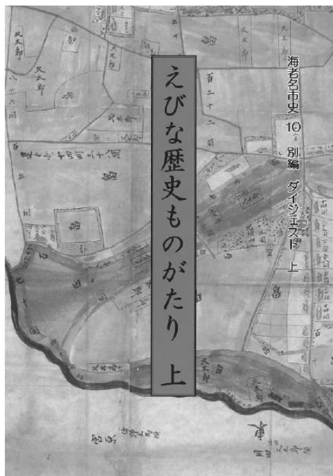
海老名市史 10 別編 ダイジェスト 上 表紙